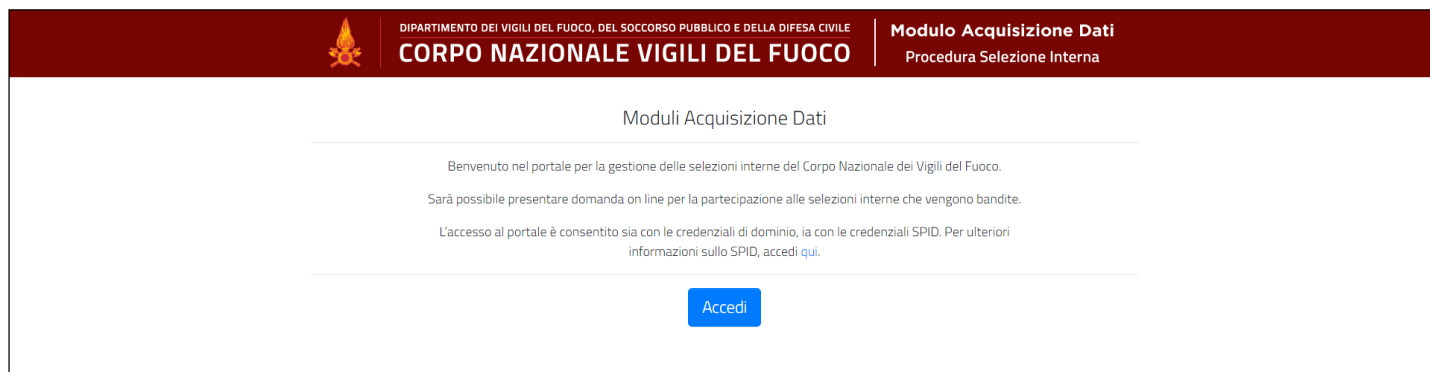
Figura 1 - Home page della piattaforma

L'applicativo è raggiungibile, solo dalla rete dipartimentale, all'indirizzo http://moduloacquisizionedati.dipvvf.it .