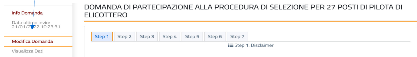
Figura 12 - Funzione modifica domanda

Fino alla scadenza del termine di presentazione della domanda, l'utente può effettuare la modifica della domanda già inviata. Accedendo al sistema, l'utente dovrà selezionare la funzionalità Modifica Domanda . Effettuare le modifiche necessarie e selezionare il tasto Invio domanda.