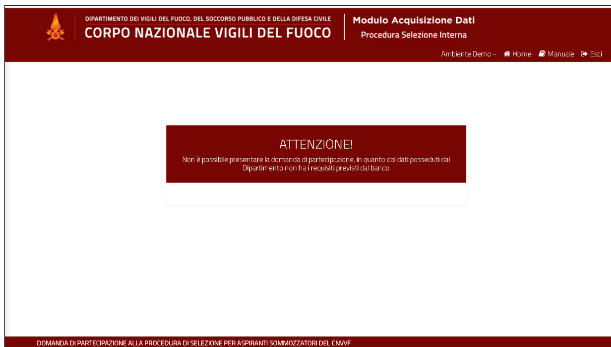
Figura 3 - Messaggio di errore per mancanza di requisiti di partecipazione

In caso contrario viene visualizzato il seguente messaggio di errore: "Non è possibile presentare la domanda di partecipazione, in quanto dai dati in possesso dal Dipartimento, non ha i requisiti previsti dal bando" .